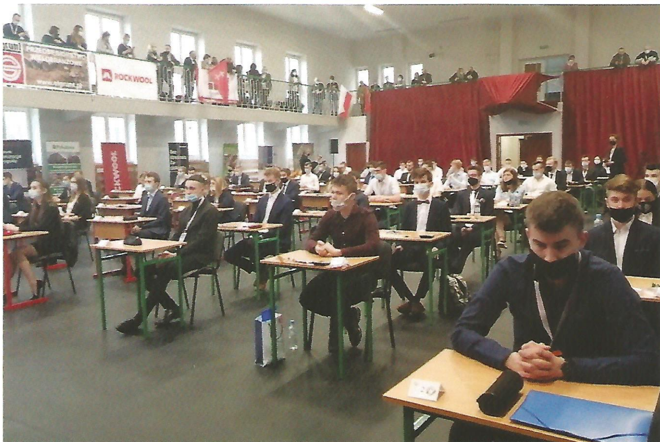
⇒ Uczestnicy zawodów centralnych w Gdańsku