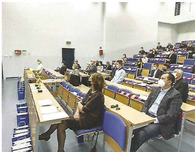
⇒ Podsumowanie Olimpiady w okręgu rzeszowskim

Dziękujemy wszystkim zaangażowanym w organizację Olimpiady na Podkarpaciu. Mamy nadzieję, że w następnych edycjach Olimpiady dołączą do nas kolejni pasjonaci. ■