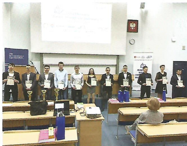
⇒ Laureaci i finaliści OWiUB